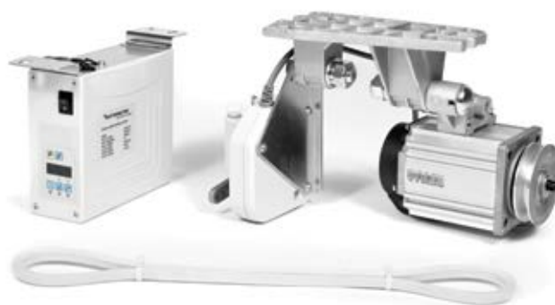
TEXI POWER 750 S